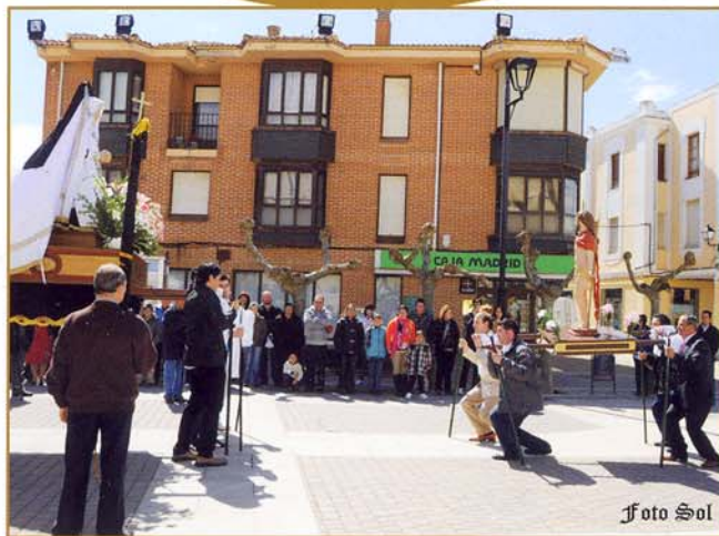
Procesión organizada por las Cofradías del Sto. Cristo de la Vera Cruz y la de Ntra. Sra. de los Dolores.

Todos los cofrades de la Vera Cruz procesionan a Jesús resucitado, al mismo tiempo, la Cofradía de la Soledad acompaña por otro recorrido a la Dolorosa, para acabar reuniéndose todos en la Plaza de España.