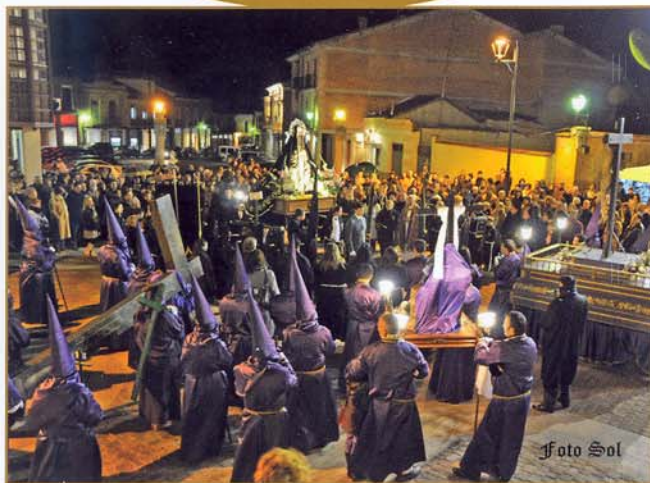
Procesión organizada por la Cofradía de Ntra. Sra. de los Dolores.

Es quizá la más emotiva de todas las procesiones, la imagen de la Virgen Dolorosa, comúnmente conocida como "La Soledad" es especialmente sobrecogedora.