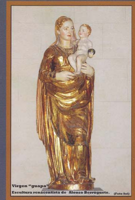
Virgen "guapa" Escultura renacentista de Alonso Berruguete.

Hoy, la cruz de Jesús es el centro de todo. Con dolor, pero más aún con admiración y con agradecimiento, nos acercamos a él y afirmamos nuestra fe en él. Porque de la cruz de Jesús, de su amor inmenso, brota vida inagotable para toda la humanidad.